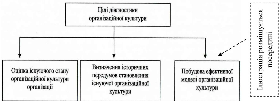
Рис. 2.2. Цілі діагностики організаційної культури.