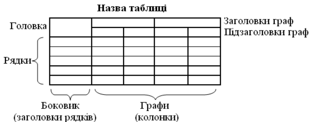
Рис. 2.3. Приклад побудови таблиці

Лінії таблиці мають бути однакової товщини і дорівнювати 0,75 пт. Кожна таблиця повинна мати назву, яку розміщують над таблицею і друкують симетрично до таблиці жирним шрифтом. Назву і слово «Таблиця» починають з великої літери. Шрифт у таблиці – той самий, що в тексті роботи (Times New Roman, розміру 14 пт.), у великих таблицях, які займають площу до двох сторінок, допускається міжстроковий інтервал (щільність), якій дорівнює 1 пт. (на відміну від тексту роботи, де щільність становить 1,5 пт.), та шрифт, який дорівнює 10 пт. Таблиці більше ніж на дві сторінки переносять у додатки.