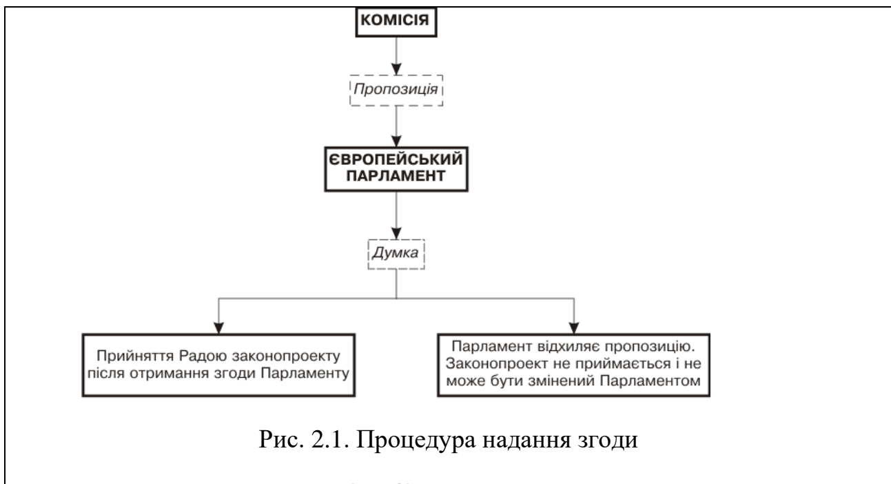
Рис. 2.1. Процедура надання згоди

Підпис під ілюстрацією зазвичай має чотири основних елементи: